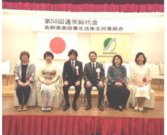
正副理事長を間に功労賞受賞者記念撮影！

第50回 通常総代会 日時 令和元年5月20日(月) 午前10時 会場 上諏訪温泉 RAKO華乃井ホテル